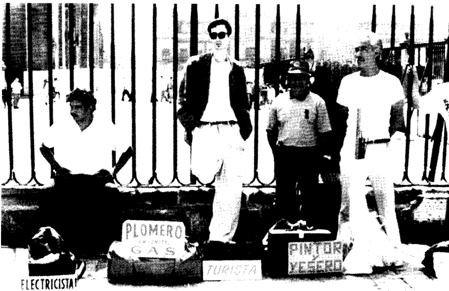
1 Francis Alÿs: Turista, 1996, eine von mehreren Fotografien.

Abgesehen davon, daß die gleichgültig und unbeteiligt scheinenden Blicke der Abgebildeten den Bildern zu einer gewissen poetischen Durchschlagkraft verhelfen, kann ihre scheinbare Nicht-Betroffenheit den Anlaß zu einer längeren Auslassung über die Methode von Alÿs Kunst geben. Die Darstellung des Künstlers als Tourist wirft ganz offensichtlich die Frage nach der Rolle des Künstlers auf. Um das Wofür oder Worin dieser Frage etwas einzugrenzen, kann ohne weiteres der öffentliche, städtische Raum als das primäre Aktionsfeld des Künstlers ausgemacht werden. Aber die Reflektion dieser kunstsoziologischen Urfrage ist nur die eine Ebene, die das Werk von Alÿs anreißt. Indem er den Typus des Touristen mit dem des Tagelöhners konfrontiert, eröffnet er zudem die Möglichkeit für zeitdiagnostische Betrachtungen.